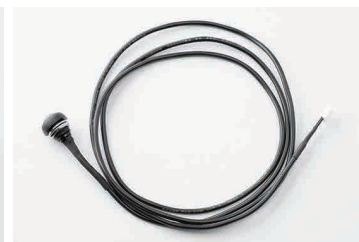
スイッチコネクタ